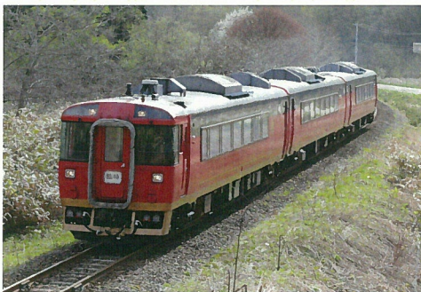
【変更前の車両】キハ183系お座敷車両 2両