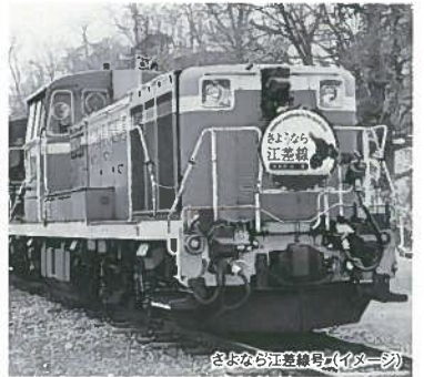
さようなら江差線号(イメージ)

JR北海道函館支社では5月10日、5月11日に「さようなら江差線企画」として、普段江差線を走行しないSL函館大沿号に使用している客車(14系)にディーゼル機関車を索引した臨時列車を函館～江差間で運転し江差への列車の旅をお楽しみいただき、また、廃止される木古内～江差間をバスにて全駅をめぐるツアーを企画致しました。廃止される直前には是非江差線の旅をお楽しみください。