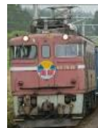
復活海峡号イメージ