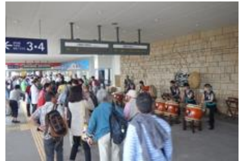
函館駅お出迎えイメージ