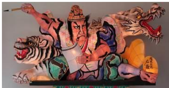
ミニねぶた イメージ

7月2日～13日の期間、函館駅改札内コンコースにて「青森ミニねぶた」・「弘前ミニねぶた」の展示と、函館駅2階多目的ホール「イカすホール」にて青森エリアの観光ポスター等の展示を行います。