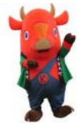
木古内町キャラクター 「キーコ」